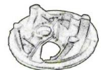
デフキャリア 120秒/個