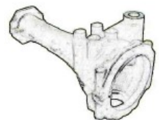
アクスルケース 120秒/個