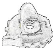
アクスルケース 40秒/個