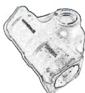
ギアボックス 24秒/個