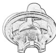
デフキャリア 24秒/個