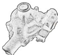
ウォーターポンプ 37秒/個